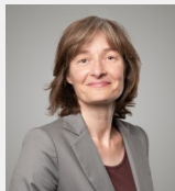
Cornelia Diethelm Shifting Society AG