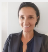
Eva Thelisson AI Transparency Institute